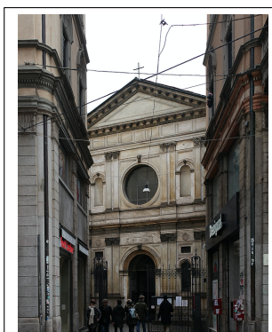
Veduta da via Torino

Quasi nascosta tra la via Torino e la via Speronari, Santa Maria presso San Satiro è uno degli edifici religiosi più affascinanti di Milano in quanto esemplificativo delle stratificazioni storiche e delle contaminazioni artistiche della città.