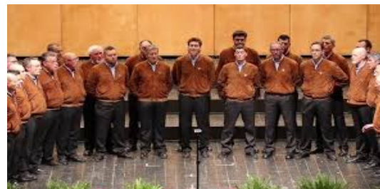
Coro di Montagna