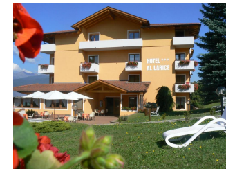
Hotel AL LARICE