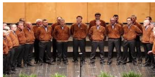
Coro di Montagna